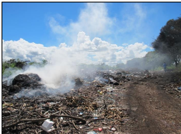
Figura No. 1. Vertedero de la Villa de Los Santos.