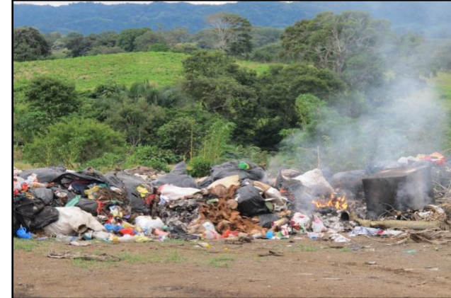
Figura No.7. Vertedero de Tonosí, disposición ordenada.