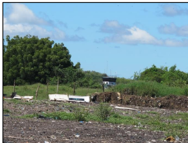
Figura No.13. Operación