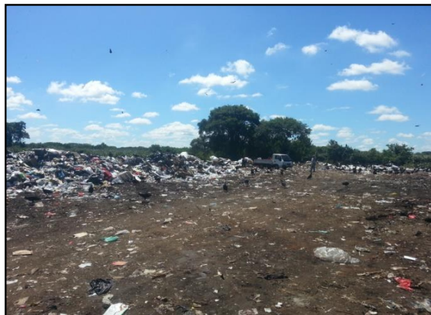
Figura No.10. Vertedero de Chiré