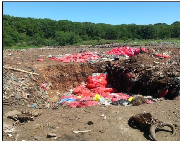
Figura No.15. Fosa de desechos hospitalarios