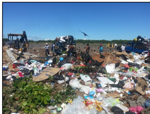
Figura No.12. Aeropuerto