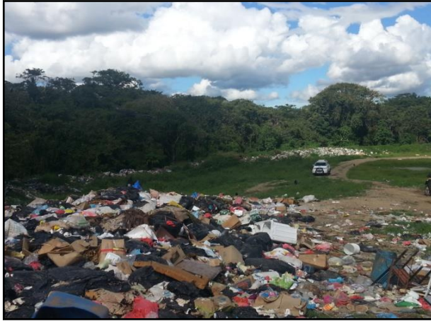
Figura No.5. Vertedero de Macaracas