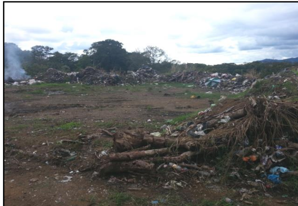
Figura No.8. Quema a cielo abierto.