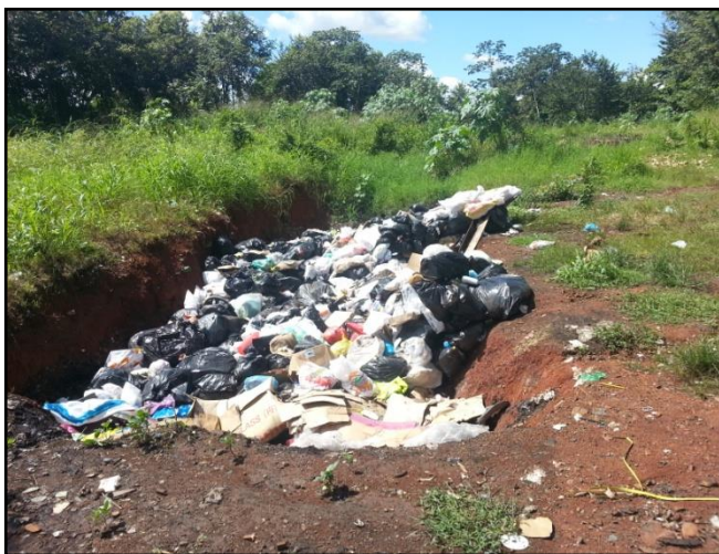
Figura No.19. Trinchera No. 3