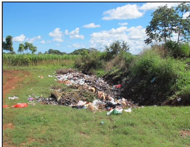
Figura No.18. Trinchera No.1