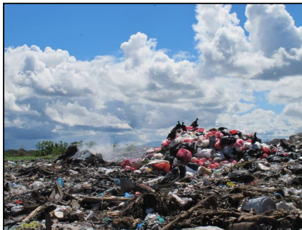
Figura No. 2. Desechos hospitalarios en grandes cantidades y sin previo tratamiento