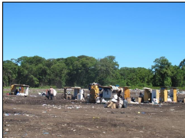
Figura No.11. Segregadores