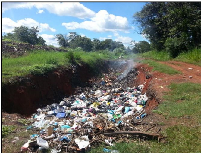
Figura No.17. Trinchera No.2