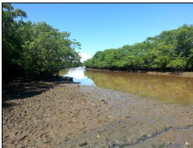
Figura No. 3 Estuario ubicado a menos de 7 metros del vertedero