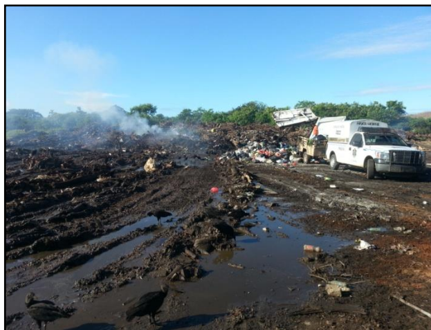
Figura No.22. Vehículo de la policía nacional