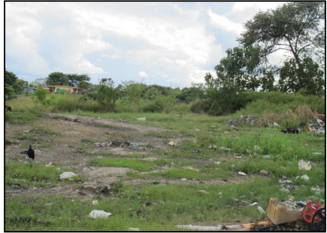
Figura No.6. Comunidad Vecina