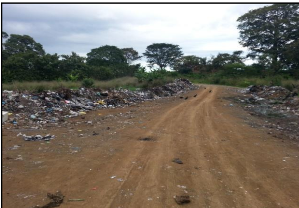
Figura No.9. Buenos caminos internos.