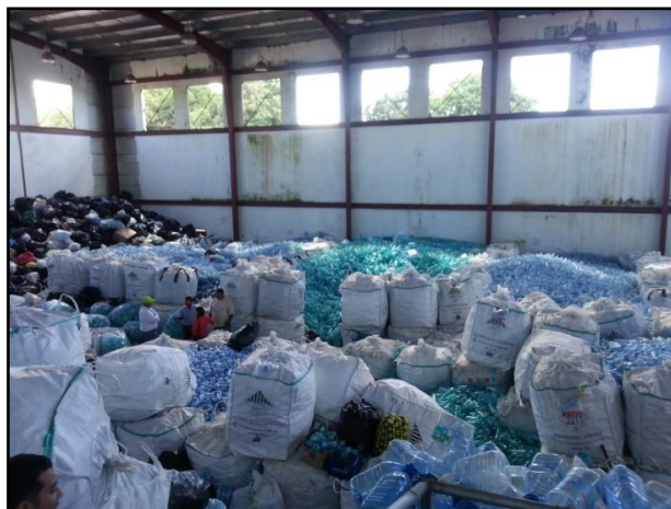
Figura No.16. Centro de Acopio de Reciclables