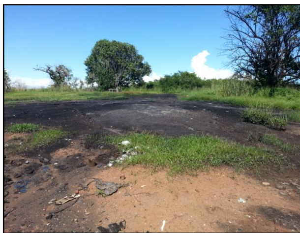
Figura No. 4. Terreno privado colindante al vertedero, quema de llantas sin control.